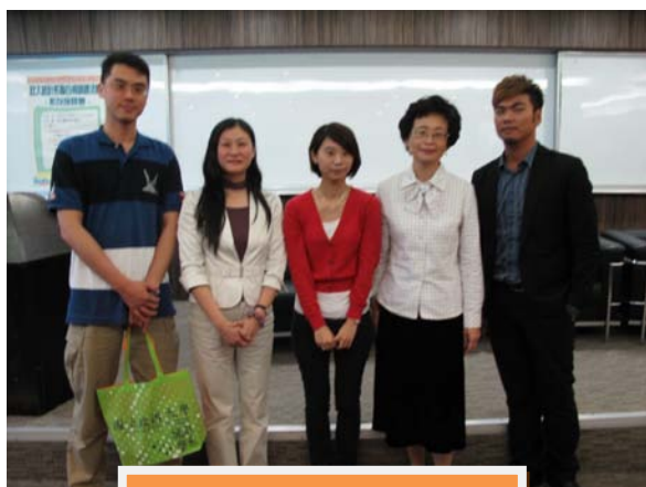
系友座談會圓滿落幕後合影。

這次的系友座談會集結了四位不同領域學長姊的分享，從他們的所見所聞不但能幫助學弟妹看得更高更遠，也讓系上師生及系友之間有更多交流的機會呢。因此，希望往後學弟妹能踴躍參與系上舉辦的類似活動，畢業的系友們也樂於回來與大家分享在職場生涯及大學生涯的心得。